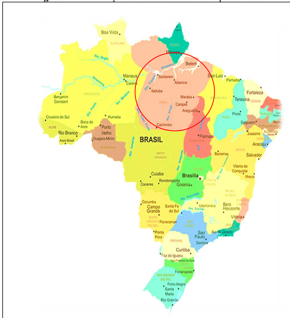
Figura 1 – Localização do estado do Pará no mapa do Brasil