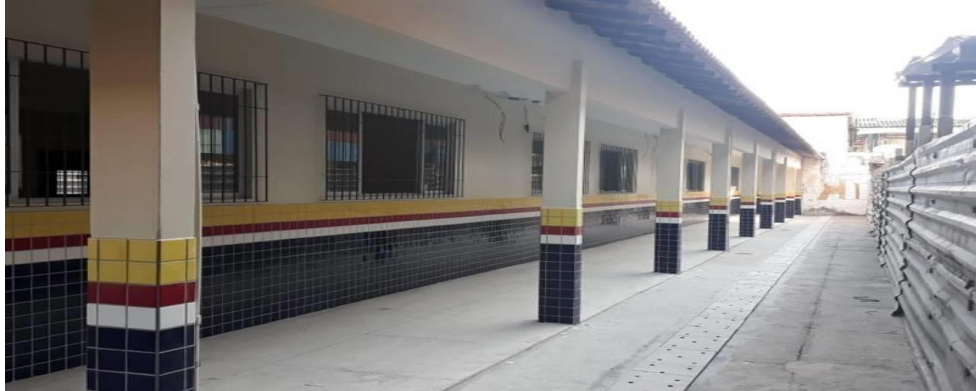
Figura 5 – Ambiente interior da EEEIFM Brigadeiro Fontenelle