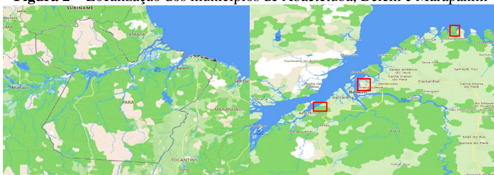
Figura 2 – Localização dos municípios de Abaetetuba, Belém e Marapanim