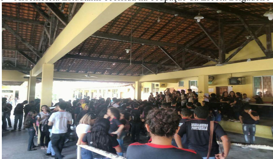
Figura 10 – Assembleia Estudantil ocorrida na ocupação da Escola Brigadeiro Fontenelle