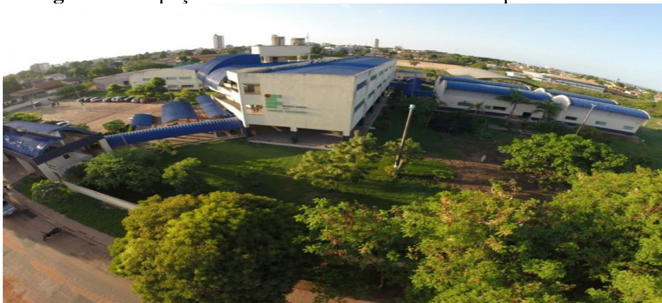
Figura 8 – Espaço externo e interno do IFPA – Campus Abaetetuba