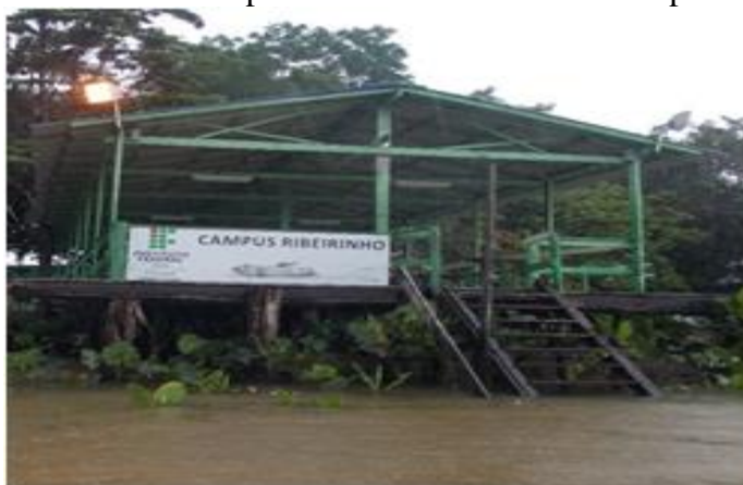
Figura 9 – Frente do Campus ribeirinho do IFPA – Campus Abaetetuba