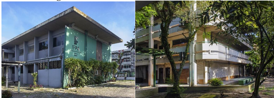
Figura 7 – Ambiente interior do IFPA – Campus Belém