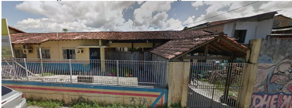
Figura 4 – Frente da EEEIFM Brigadeiro Fontenelle