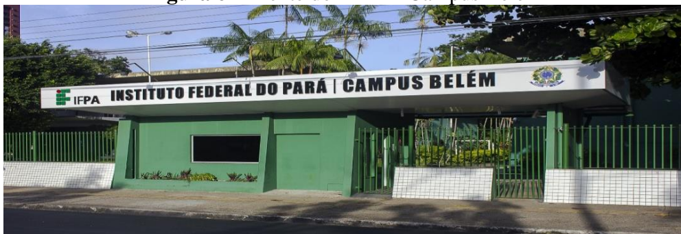
Figura 6 – Frente do IFPA – Campus Belém