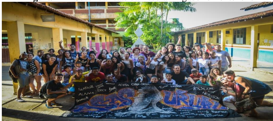
Figura 11 – Secundaristas da Escola Brigadeiro Fontenelle