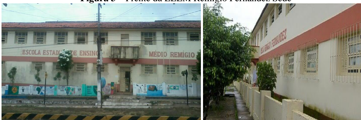
Figura 3 – Frente da EEEM Remígio Fernandez Sede